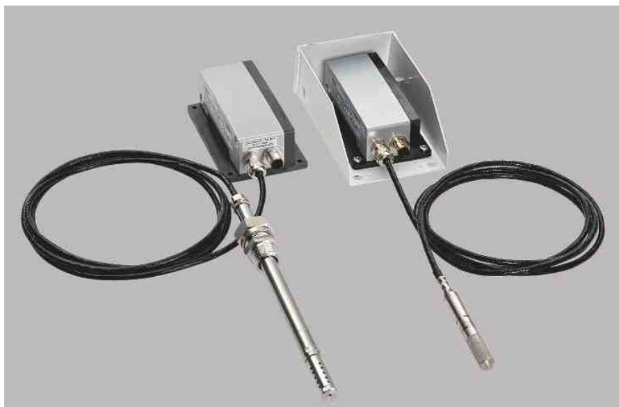
Dos opciones de sonda: MMT318 y MMT317. El protector opcional de lluvia está también disponible.